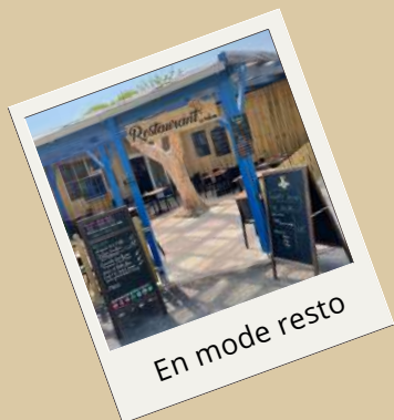
En mode resto

Petit déjeuner, déjeuner et dîner : à la carte et à emporter. Breakfast, lunch & dinner, and take out