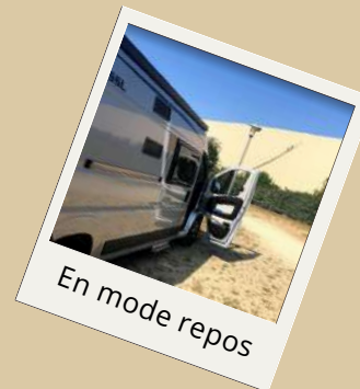
En mode repos

Lignes de bus vers les plages océanes et villes alentours : horaires à la réception et sur www.bus-baia.fr . Bus line: hours at the reception desk and online