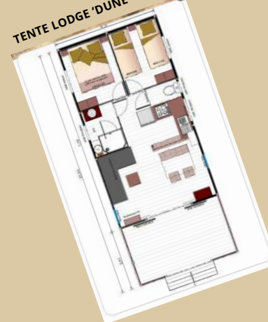
TENTE LODGE 'DUNE' 4/5 PI