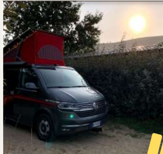
Sous les étoiles

CAMPING-CAR, CARAVANE OU TENTE MOTOR-HOME, CARAVAN OR TENT PITCH