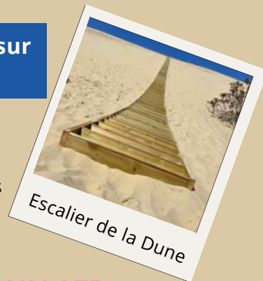
Escalier de la Dune