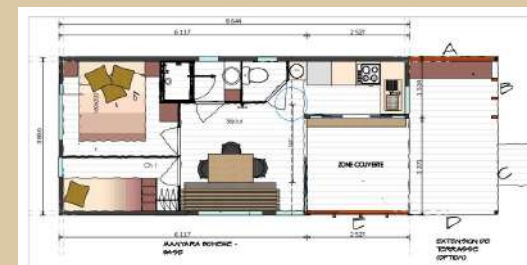
MOBIL-HOME BOHEME 4PI

LIVING ROOM WITH REVERSIBLE A/C UNIT Living area: Sofa, armchair and coffee table Dining area: 1 table with chairs Kitchen area: 1-bowl sink with drainer 1 fridge/freezer 1 microwave 1 Drip coffee maker 4-burner ceramic hob Crockery and equipment for 6 people